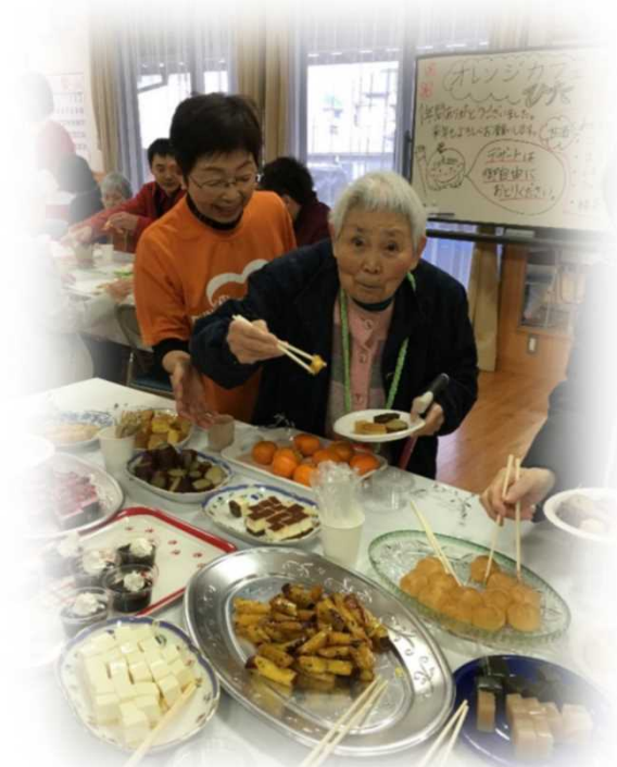
【年に2回のケーキバイキング】