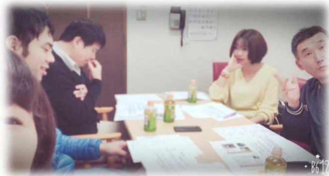
【実行委委員で定期的に打ち合わせ】