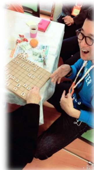
【リクエストで将棋を さすことも】