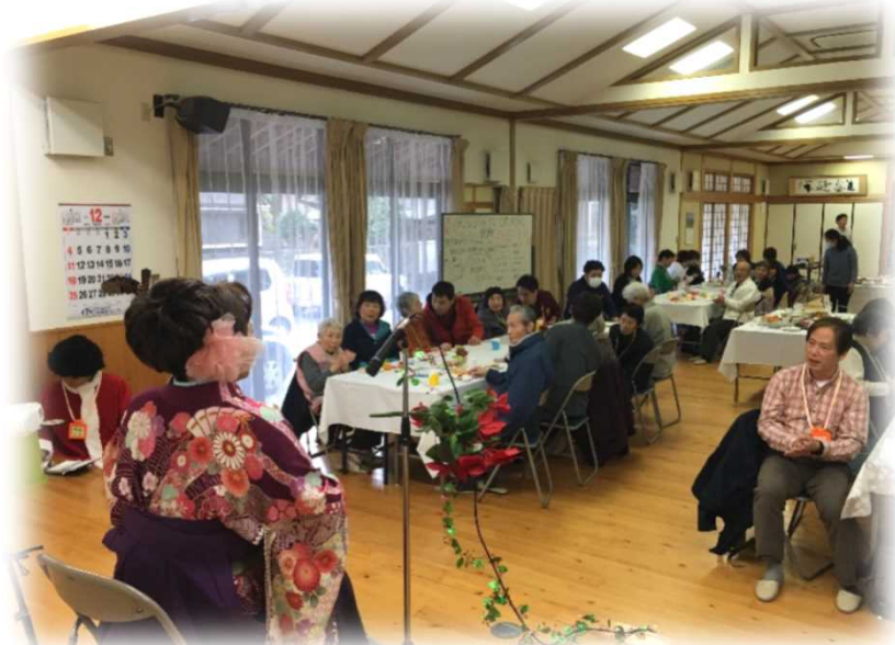
【日田出身の民謡歌手をお招きしてミニコンサート】

“参加者の声を大切に” “愉しく笑顔で過ごせるひと時を”をモットーに、その時々のご要望にお応えしながら「また来たい」と思っていただけのカフェを目指しています。